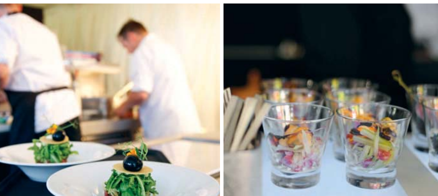
Gent, Antwerpen en Hasselt verwennen de smaakpapillen. GF

Fijnproevers hebben de komende weken een drukke agenda. Waar wordt u verwacht?