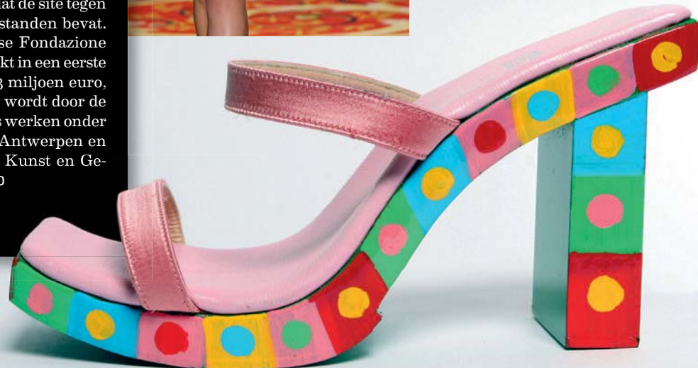
Schoen van Fendi voor lente / zomer 2000. GF / MUSEO ROSSIMODA