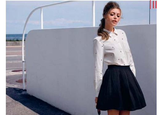
Blouse en rok van Selected Femme. GF

INFO : WWW.WELCOMETO BUTIK.COM , POP-UP SHOP BUTIK, ACADEMIESTRAAT 12 IN BRUGGE.