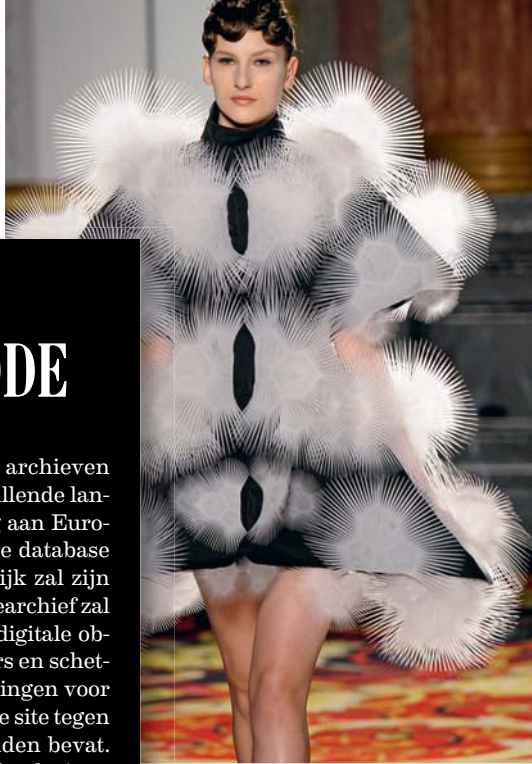
Haute couture van Iris van Herpen voor lente / zomer 2013.

Ruim twintig Europese musea, archieven en instellingen uit twaalf verschillende landen verlenen hun medewerking aan European Fashion, een gloednieuwe database die later deze maand toegankelijk zal zijn voor het grote publiek. Het onlinearchief zal aanvankelijk ongeveer 100.000 digitale objecten bevatten, van foto's, posters en schetsen tot modecatalogi en uitnodigingen voor catwalkshows. Bedoeling is dat de site tegen maart 2015 zo'n 700.000 bestanden bevat. Het project van de Italiaanse Fondazione Rinascimento Digitale beschikt in een eerste fase over een budget van 3,3 miljoen euro, dat grotendeels gefinancierd wordt door de Europese Commissie. Bij ons werken onder meer het ModeMuseum in Antwerpen en de Koninklijke Musea voor Kunst en Geschiedenis in Brussel mee. WD INFO : WWW.EUROPEANAFASHION.EU .